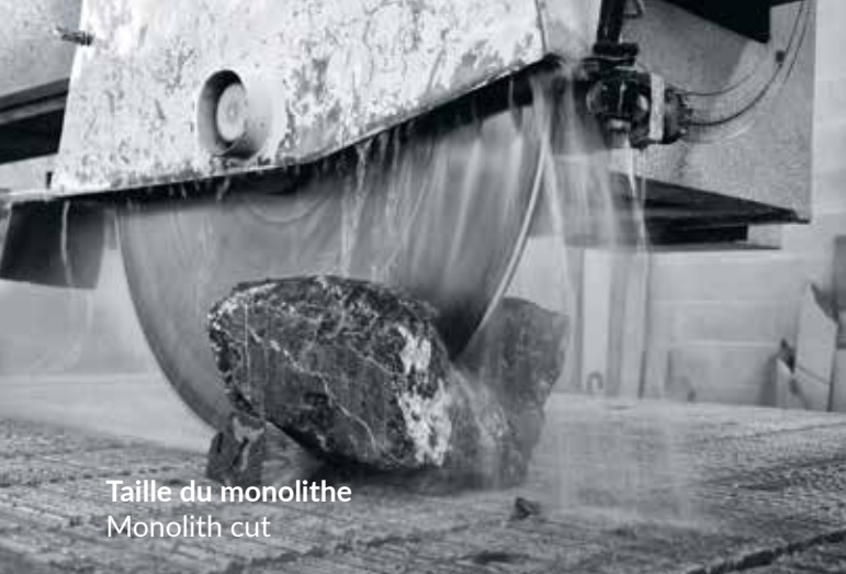
Taille du monolithe Monolith cut