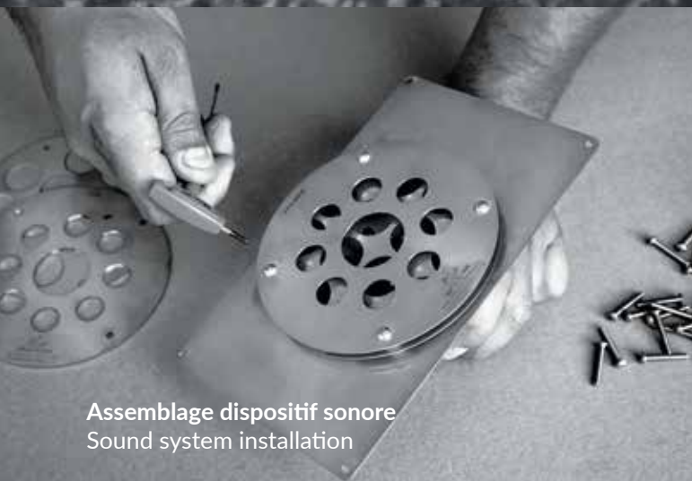
Assemblage dispositif sonore Sound system installation

CHAQUE PRODUIT EST UNIQUE... CAR LE MATÉRIEL DE DÉPART EST UNIQUE