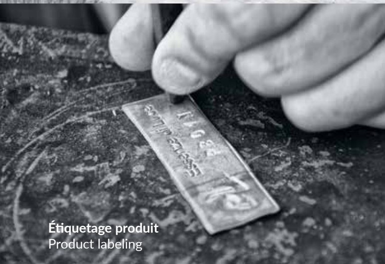
Étiquetage produit Product labeling