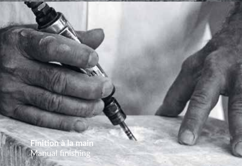
Finition à la main Manual finishing