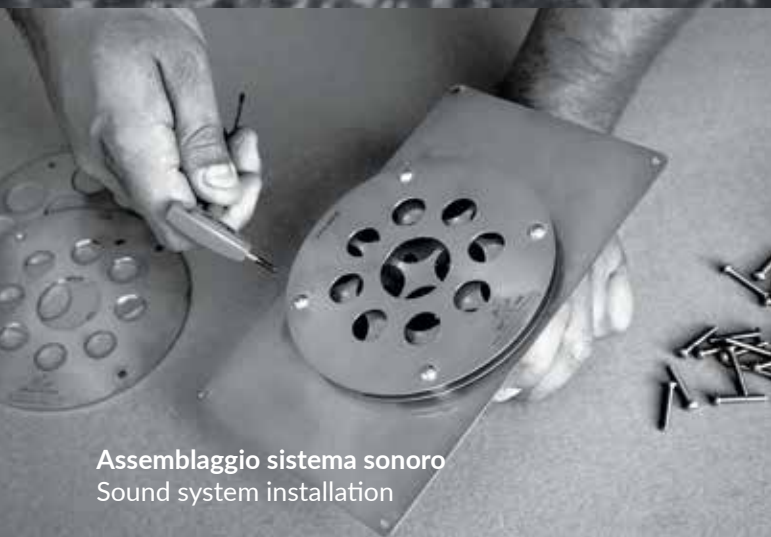
Assemblaggio sistema sonoro Sound system installation

OGNI PRODOTTO È UNICO...COME UNICO È IL MATERIALE DI PARTENZA