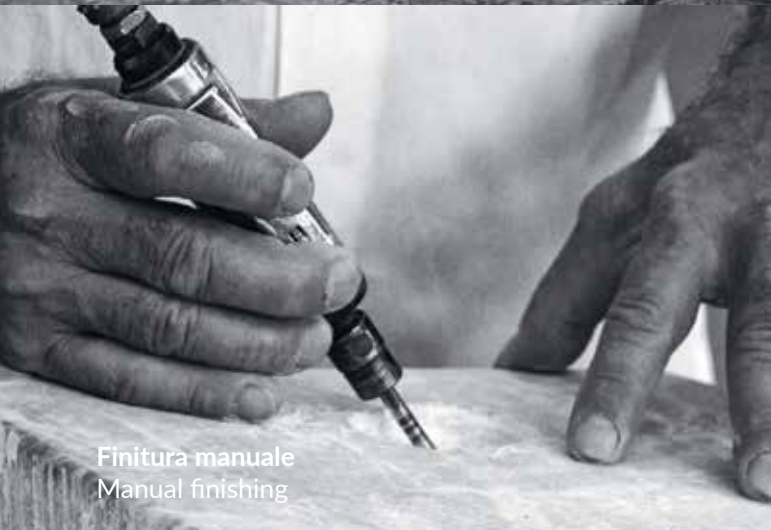
Finitura manuale Manual finishing