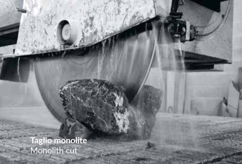
Taglio monolite Monolith cut