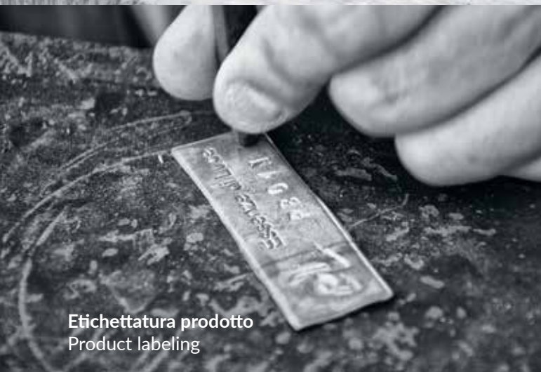
Etichettatura prodotto Product labeling